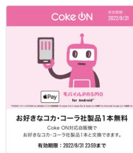
限定デザイン ドリンクチケット